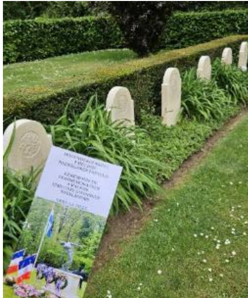
Het Nederlandse ereveld te Oiry-la-Ville, 4 mei 2026