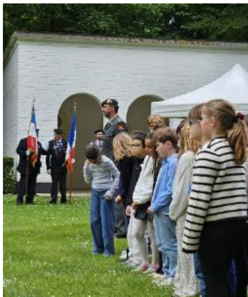
Kinderen aangetreden bij de vlag