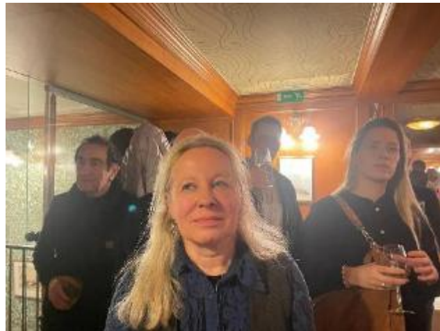
De zaal goed gevuld