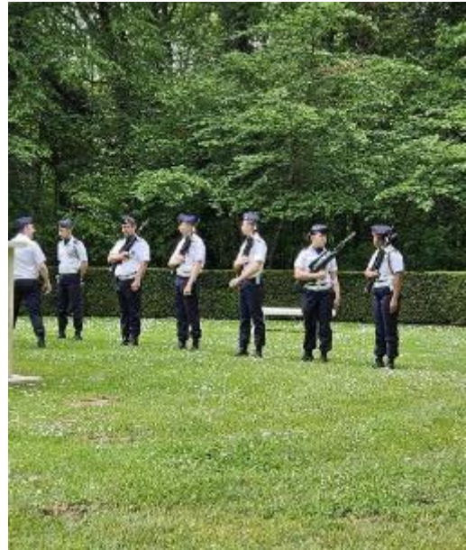
Erewacht opgesteld voor de plechtigheid