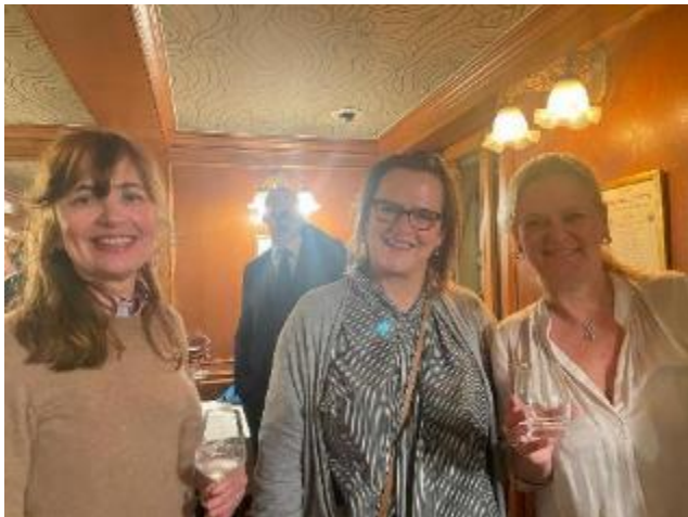
Aanwezigen genieten van de avond