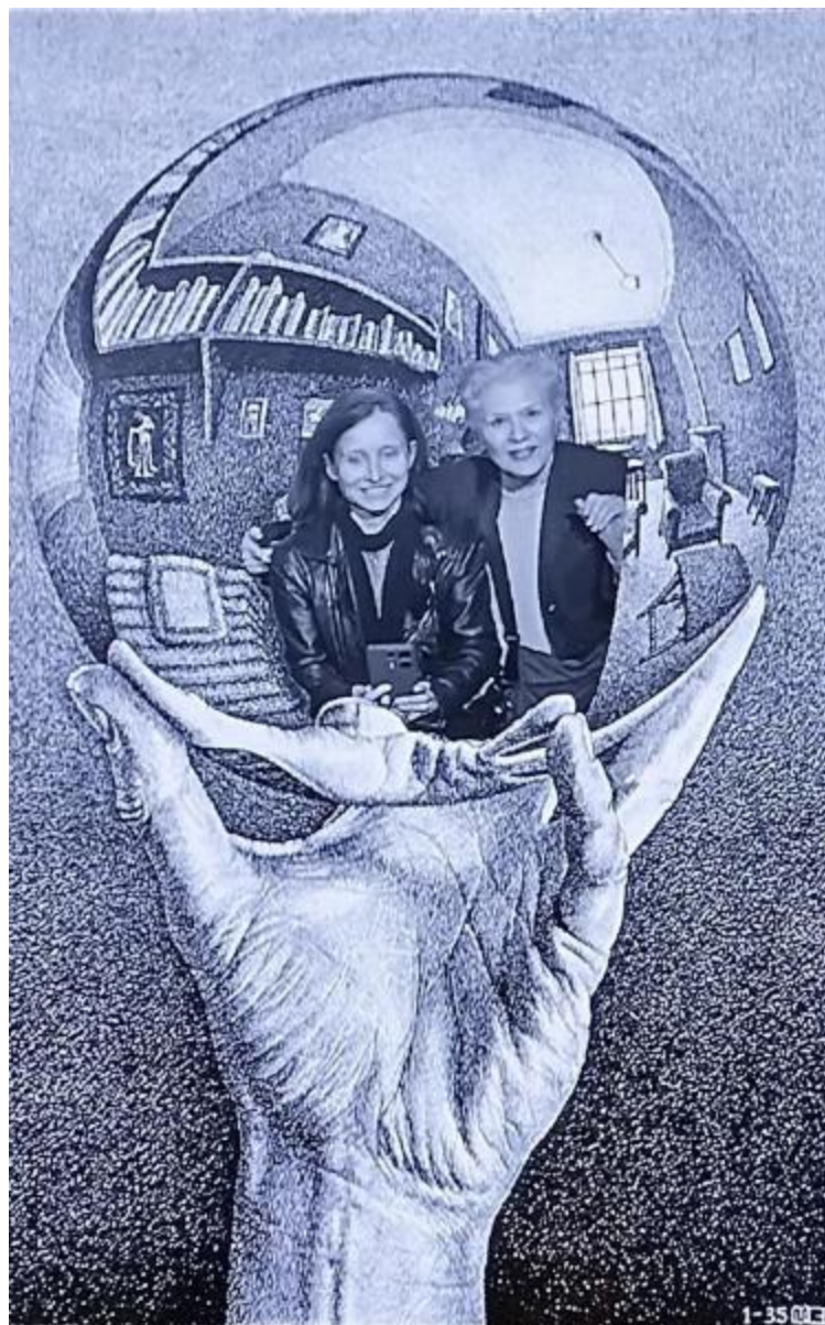
Hand met spiegelende bol