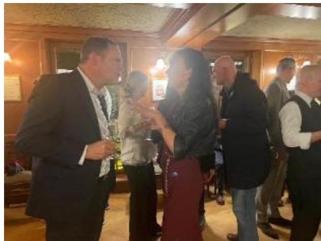
Leden luisteren aandachtig