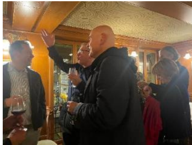
Nieuwe en oude vrienden