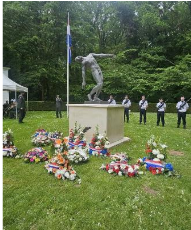
Het monument na afloop van de kranslegging, omringd door bloemen en kransen

Wij herdenken met respect, wij leven met dankbaarheid.