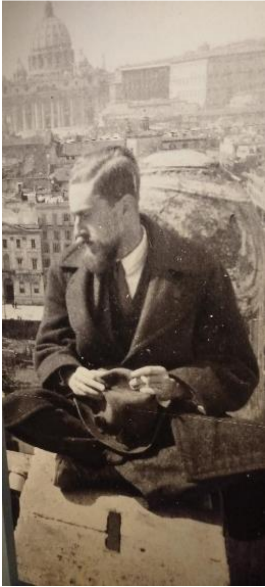
Maurits Cornelis Escher