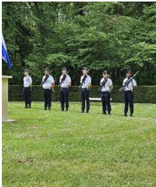
Erewacht in positie bij het monument