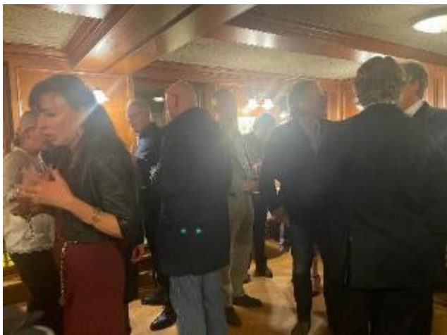
Toespraak van de voorzitter

Na de officiële borrel was de avond voor een aantal enthousiaste deelnemers nog niet voorbij: zij trokken gezellig door naar het restaurant op de begane grond van La Mascotte, waar de sfeer er niet minder gezellig op werd.