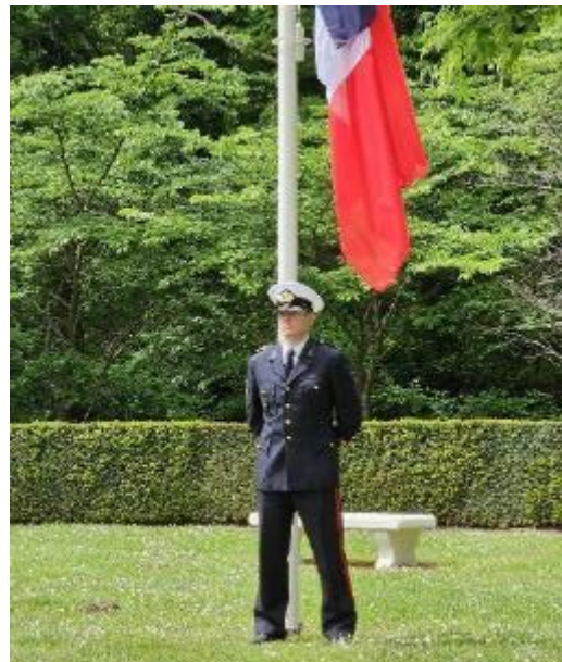
Officieel bij de vlaggenmast