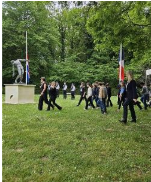
Schoolkinderen zingen IMAGINE van de Beatles