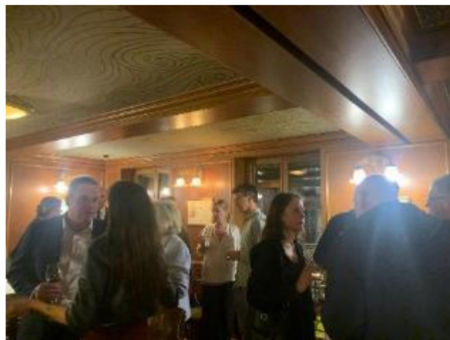
Tot de volgende activiteit!

Wij kijken terug op een geslaagde avond en danken alle leden die aanwezig waren voor hun gezelschap. De nieuwjaarsreceptie is elk jaar opnieuw een mooie bevestiging van wat de NLVP drijft: een warme, actieve gemeenschap van Nederlandstaligen in Parijs.