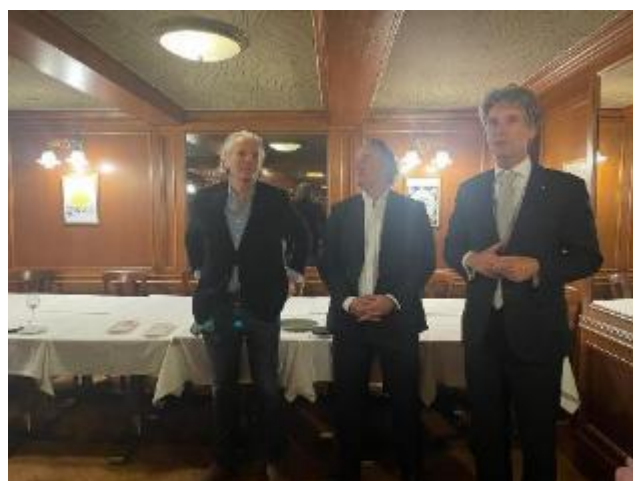
Speech van de Ambassadeur