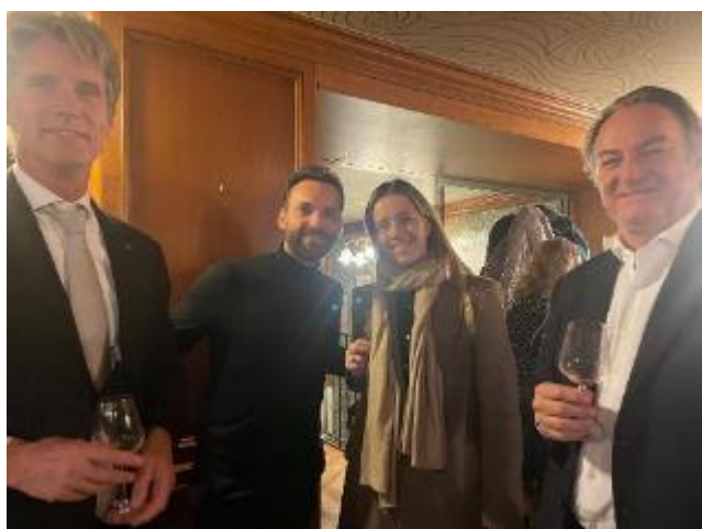
Een volle zaal bij Brasserie La Mascotte

De opkomst was uitstekend. Een mooie mix van jong en oud, van mensen die al jaren in Parijs wonen en van relatieve nieuwkomers – samen vormden zij een levendige en gevarieerde groep. Precies zoals het hoort bij een gelegenheid die ertoe dient om het nieuwe jaar samen in te luiden en nieuwe en oude contacten te vernieuwen.