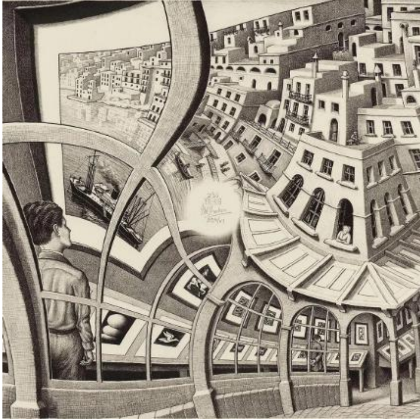
Prentententoonstelling (met Droste-effect)