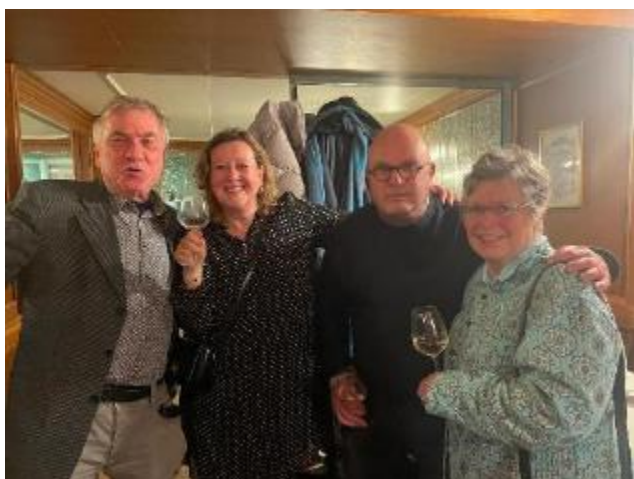
Een gevarieerd gezelschap

Zoals ook elders werd opgemerkt: het was bijzonder prettig om te zien hoe de nieuwjaarsborrel, gezamenlijk georganiseerd door beide verenigingen, uitgroeide tot een echte ontmoetingsplek – niet te massaal, maar met precies de juiste sfeer voor een goed gesprek.