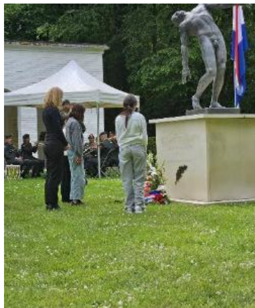
Kranslegging aan de voet van het monument