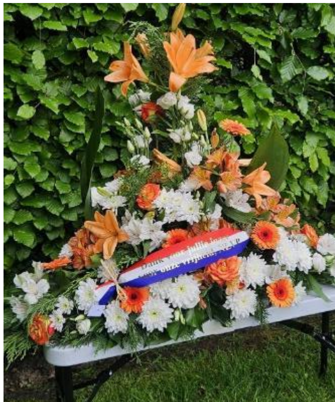
"Dank voor jullie inzet voor onze vrijheid" – de krans van de NLVP